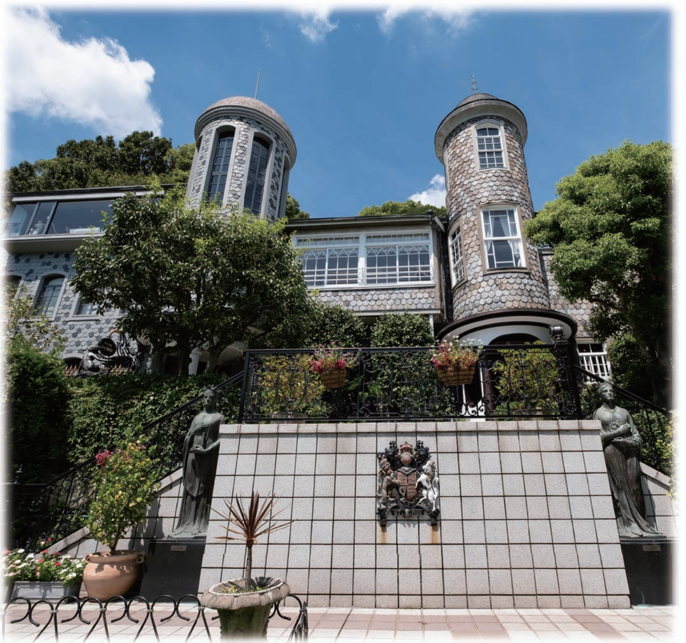
うるこの家 (神戸市)